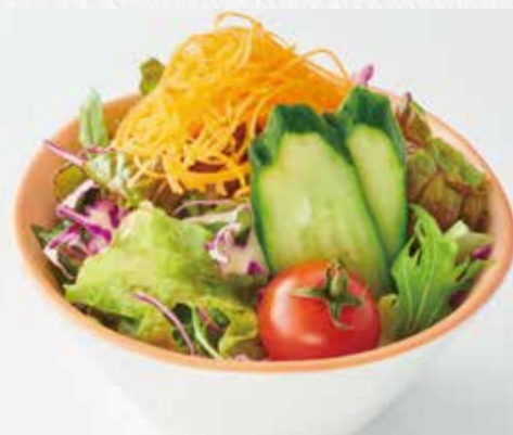
ミニサラダ 350円(税込)