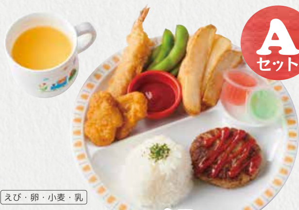
ハンバーグセット