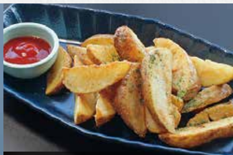
フライドポテト 480円(税込)