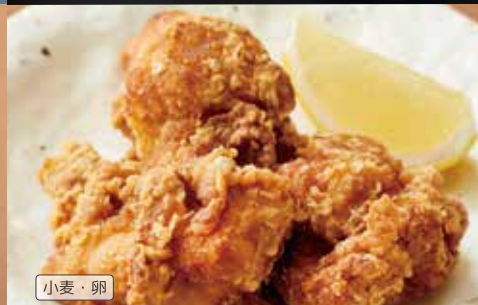
たこザンギ 580円(税込)