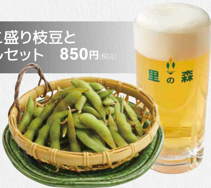
てんこ盛り枝豆と ビールセット 850円(税込)