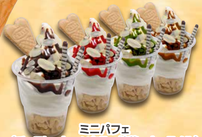
ミニパフェ (チョコレート・いちご・抹茶・キャラメル)