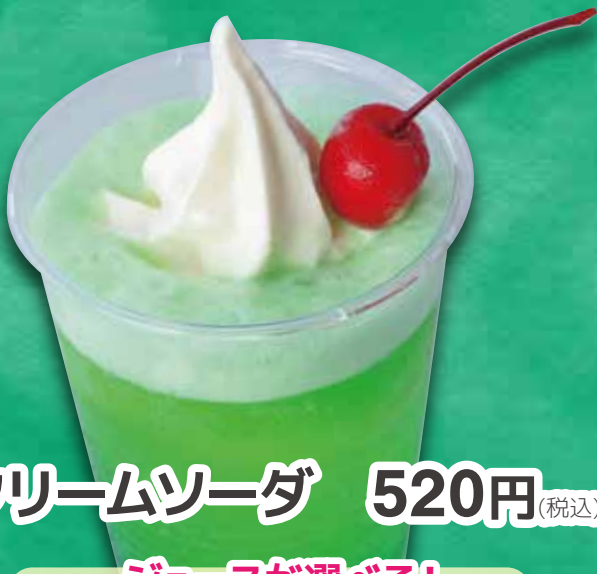
クリームソーダ 520円 (税込)