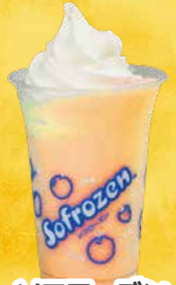
ソフローズン ソフト (メロン・オレンジ)