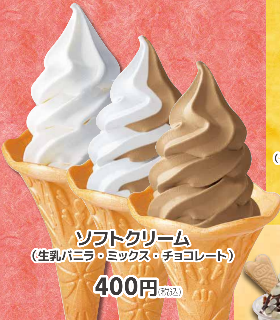
ソフトクリーム (生乳バニラ・ミックス・チョコレート)