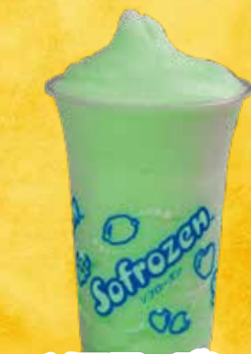
ソフローズン (メロン・オレンジ)