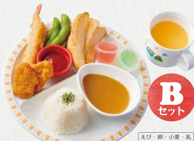
マイルドカレーセット