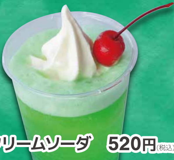
クリームソーダ 520円 (税込)