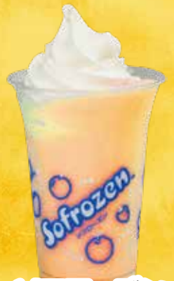
ソフローズン ソフト (メロン・オレンジ)