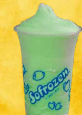
ソフローズン (メロン・オレンジ)