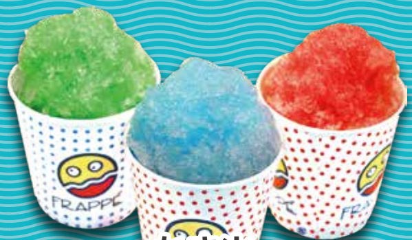
かき氷 (メロン・ブルーハワイ・いちご)

メロンソーダ、コカ・コーラ 山ぶどうソーダ、カルピス カルピスソーダ、ウーロン茶 メロカルソーダ(メロン&カルピス) 100%オレンジジュース